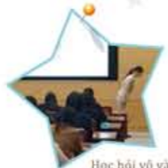
Học hỏi vô tận điều có ích cho suốt cuộc đời