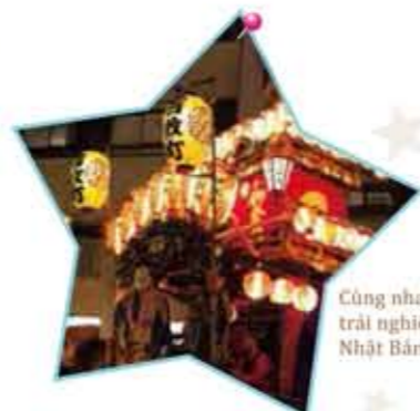
Cùng nhau thưởng thức, trải nghiệm các Lễ hội của Nhật Bản với bạn bè, đồng nghiệp