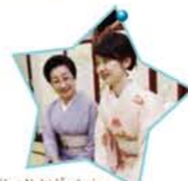
Học Nghi lễ xã giao